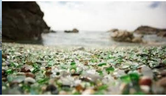
PLAYA DE LOS CRISTALES (LAXE)